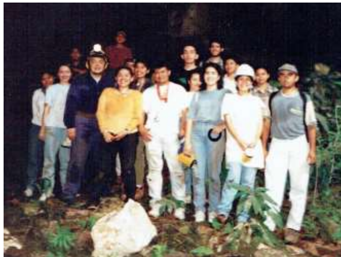
Fig. Primera expedición 25 de febrero de 1997

Este grupo se formó en el año de 1997 a partir de la iniciativa de un grupo de alumnos y un profesor de la Facultad de Ciencias Antropológicas. En sus inicios, el interés por las cuevas se enfocaba básicamente en la exploración y la aventura. Sin embargo, justo es señalar que desde entonces ya existía un incipiente rigor en la técnica de conocer las grutas y también ya se empezaba a efectuar cierto nivel de registro que permitía la descripción de las cavernas visitadas (Fig. 1).