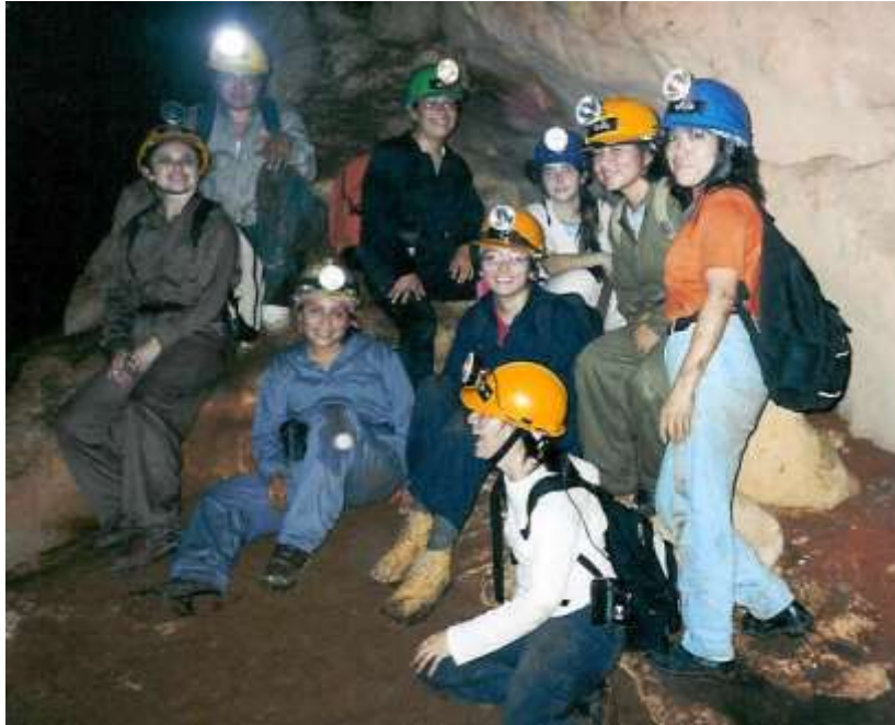
Fig. 4 Cueva Xpukil, Opichén, Yucatán

Es indispensable mencionar que desde el principio de su existencia el Grupo Ajau estuvo conformado por una mayoría de mujeres, quienes demostraron toda la capacidad y entereza para realizar cualquier labor igual o mejor que los hombres. A muchos intriga esta circunstancia pero el grupo ha funcionado durante más de 21 años sin algún inconveniente y si con un progreso constante. Posiblemente esta mayoría femenina sea el factor que le da su gran fortaleza (Fig. 4).