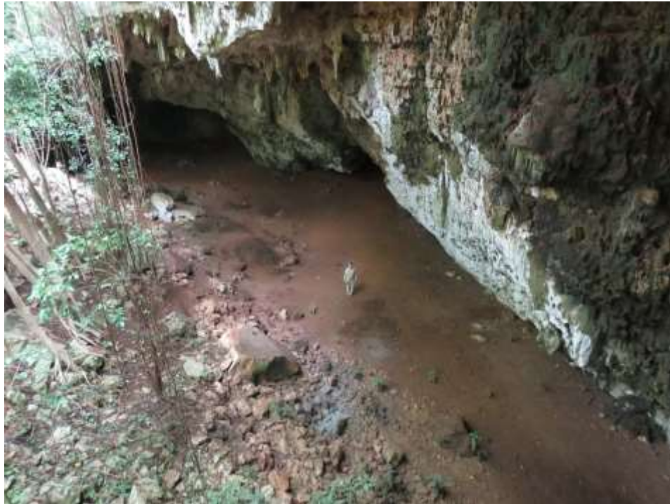
Fig. 3 Gruta Chakleón, Opichén, Yucatán.

Desde un principio se consolidó un grupo de personas que tomaron consciencia de que la espeleología es mucho más que un paseo o un deporte extremo. Este grupo inicial introdujo la seriedad y la disciplina que requirió esta actividad científica. Además este núcleo de integrantes empezó a lograr resultados académicos especialmente en el campo de la arqueología y la antropología social. Posteriormente se fueron uniendo miembros con otras especialidades como la biología, la medicina y la legislación sobre el medio ambiente. Todo estos avances se lograron sin dejar de gozar de la belleza de las cavernas y la emoción de explorarlas (Fig. 3).