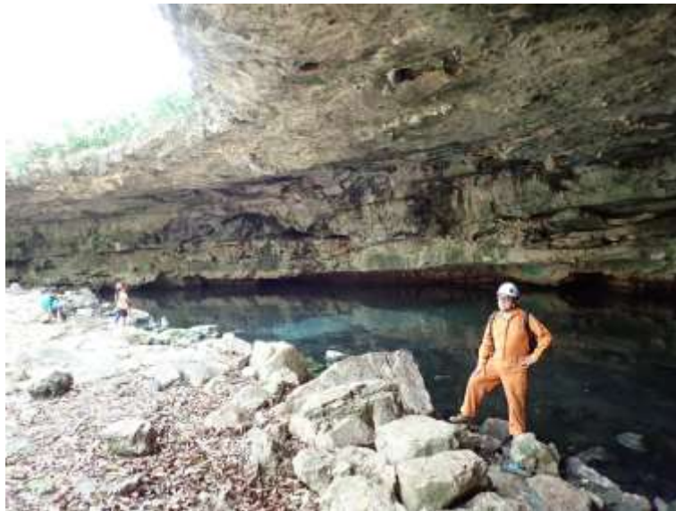
Cenote Yoo Já, Abalá, Yucatán

contacto@ajau.org.mx Twitter @aktunmeyaj