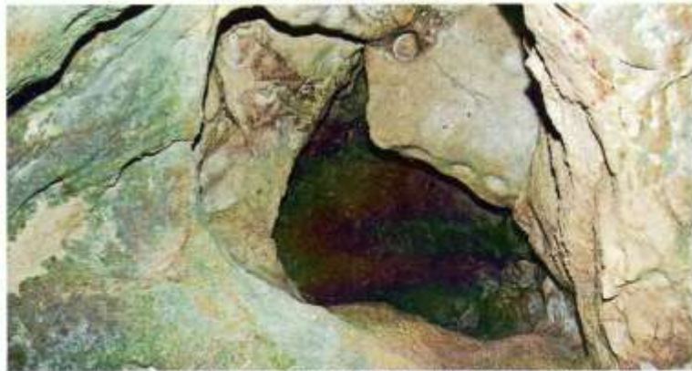
Cavidades que se forman en los techos de la gruta del cenote "Sambulá"