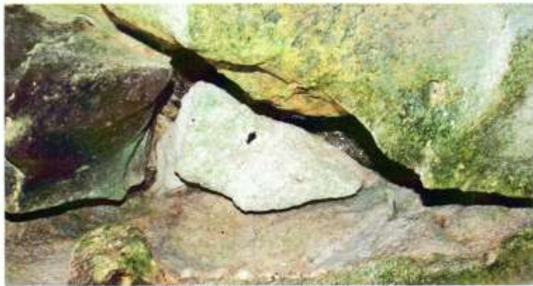
Piedra conocida como "La Campana"

Debido a sus cristalinas aguas, el cenote Sambulá, ubicado en la calle 41 entre 24 y 26 de esta ciudad, hoy día es visitado por los habitantes de Motul, la gente de los municipios vecinos y por turistas de Estados Unidos, Inglaterra, Italia, Argentina y, por supuesto de otros estados de nuestro país. Su encanto natural hace que mucha gente regrese a deleitarse en sus frescas aguas. Cabe mencionar que Motul es una ciudad con todos los servicios de hospedaje y transporte que un turista pueda necesitar, es el lugar de origen de los mundialmente famosos "huevos motuleños", y es el sitio ideal para conocer la rica variedad gastronómica de Yucatán.