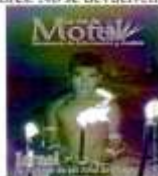
PORTADA: Israel, El hombre de los Armas de Fuego.

Queda estrictamente prohibida la reproducción total o parcial de los contenidos e imágenes de la publicación sin previa autorización por escrito del editor. El contenido de los artículos son responsabilidad de los autores. No se devuelven originales.