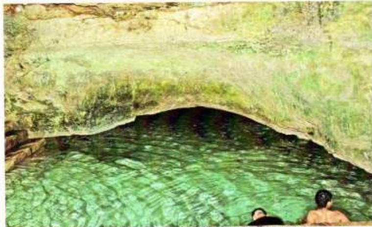
Aguas cristalinas del cenote, son un deleite para los bañistas.

Señala en su documento que cuando era niño, le fue contado un relato fantástico que le produjo miedo, pero que por lo mismo causó su interés por el tema. Por medio